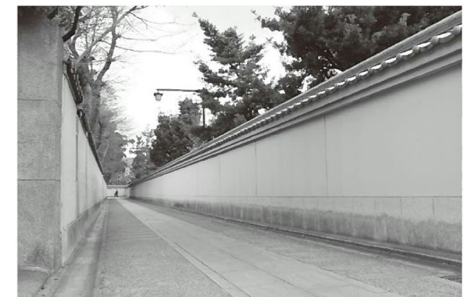
聖福寺境内裏参道