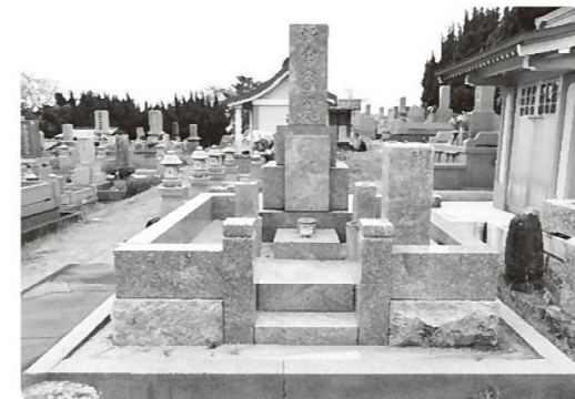
リフォーム前のお墓