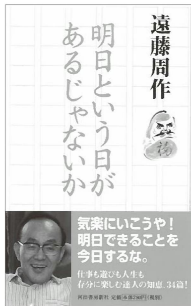
(河出書房新社) 発行日：2015年9月14日

フェレイラの墓はその日、遂に発見できなかったが私はひどく満足だった。それ以後、長崎に行くたび、その墓を見に行くことを欠かさない。