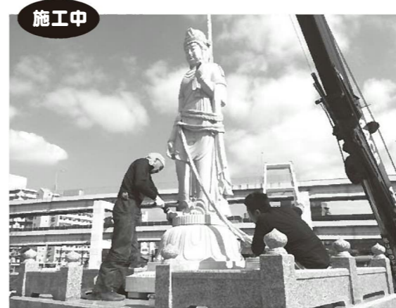
臨済宗 幻住庵 福岡市博多区御供所町7-1