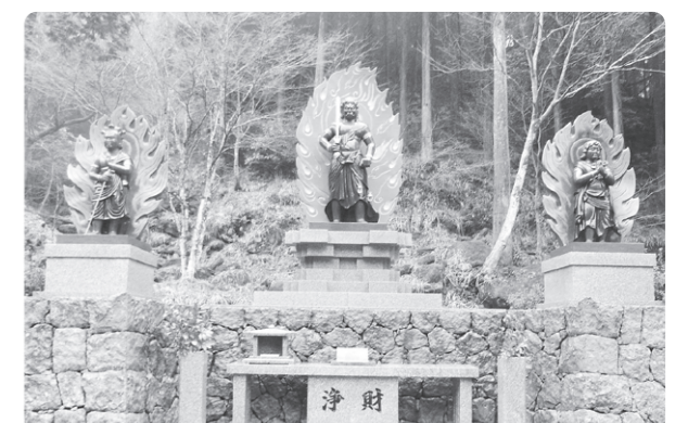
「英彦山不動明王」2006年 英彦山大権現