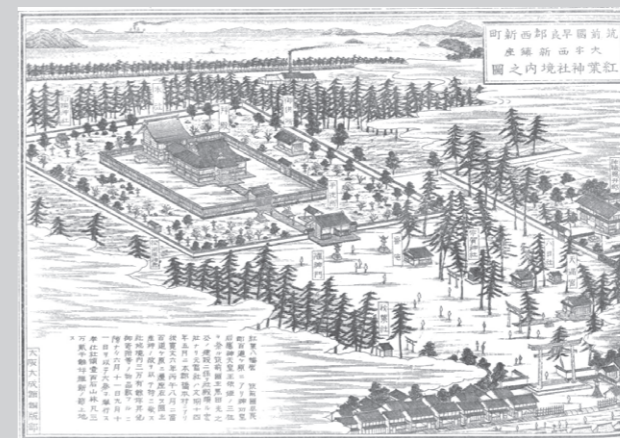
江戸時代の紅葉八幡宮

明治に時代が変わると社領を返上し、1913年に現在の場所へ遷座することに。現在の西新エリアは通勤族の多い町ですが、300年続くお祭りや季節ごとの神社行事によって、住民のつながりを深めているそうです。