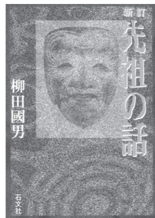
先祖の話 新訂版 発行所：株式会社石文社