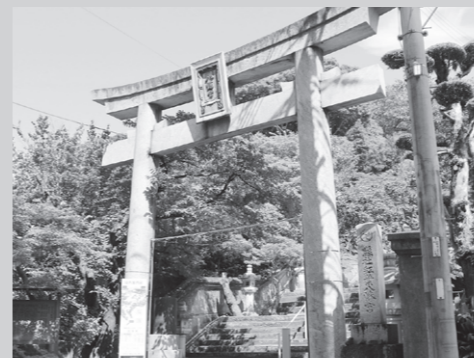
梶井宮親王の神額が残る鳥居 現在は青銅色だが、かつては黄金だった