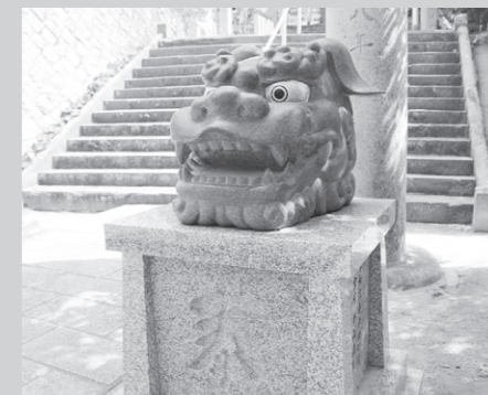
獅子頭 令和御大典記念と、 新型コロナウイルス終息祈願 に作られた獅子頭 弊社施工