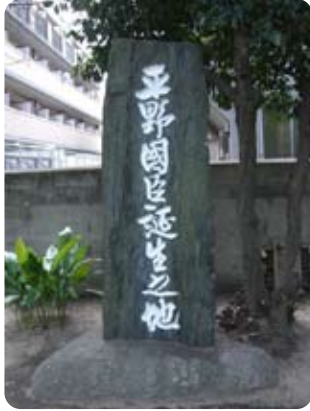
↑ 国臣生誕の地(平野神社境内)

この歌は、筑前(福岡県)の勤王志士・平野国臣が詠んだ歌です。まだ汽車も走っていない一五〇年前、幕末の日本を駆け回り、尊王攘夷運動に奔走した若者です。