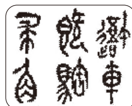
橋口臨『呉昌碩 臨石鼓文』