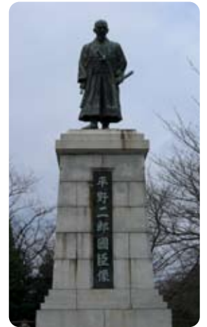
→国臣銅像…高さ三・七メートル。威風堂々、どこか表情は険しい。（福岡市中央区西公園参道）

そして、元治元年（一八六四年）の禁門の変（蛤御門の変）で、捕えられていた志士とともに処刑されます。享年三十七歳。福岡藩で最初に尊王倒幕を唱え、覚悟を決め、脱藩してわずか七年、道半ばの死でした。