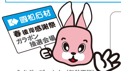
うさぎのぴよん太 (年齢不詳) ☆今回もこりずに登場☆