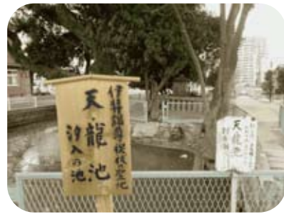
↑住吉神社の西門正面に位置する、天津神社の祭神は伊弉諾大神です。社地はもともと海だった名残であるという天龍池（潮入りの池）の中央にあり、こここそが住吉三神の誕生した禊祓の場所とされます。

料館所蔵「三奈木黒田家文書」文化九年（一八一二年）写／によると、それがまさにここ住吉の地を指す、めでたい地だ、と書き込まれています。