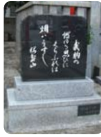
↑歌碑（平野神社境内）

この歌碑は、生家の福岡市だけではなく、鹿児島や伊集院町にもあります。国臣の果たした役割の大きさを表れだといえます。